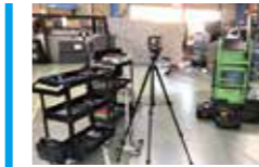
ARC東京 (浦安) 充実のエーミング資機材、純正スキャンツールも多数揃う車検・钣金デポ