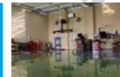
ARC九州 (福岡) 広いエーミングスペースに最新のエーミング設備が並ぶランテル福岡営業所