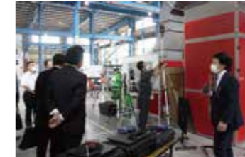
お近くで研修が行われない場合でも、アーカイブ映像でご覧いただけます。