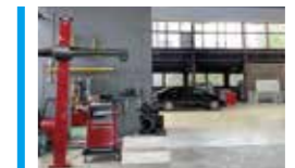
ARC北海道 (札幌) 経験豊富なスタッフと10x11mのエーミングスペースが揃う宮田自動車商会テクニカルセンター