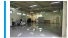
ARC東北 (仙台) 経験と知識を併せ持つスペシャリストが在籍する山形部品Y-PIT仙台