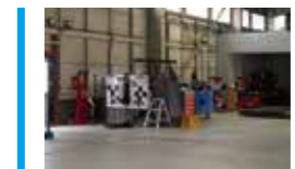
ARC東北 (山形) グループ全体でエーミング月平均100件以上の実績を持つ山形部品本社